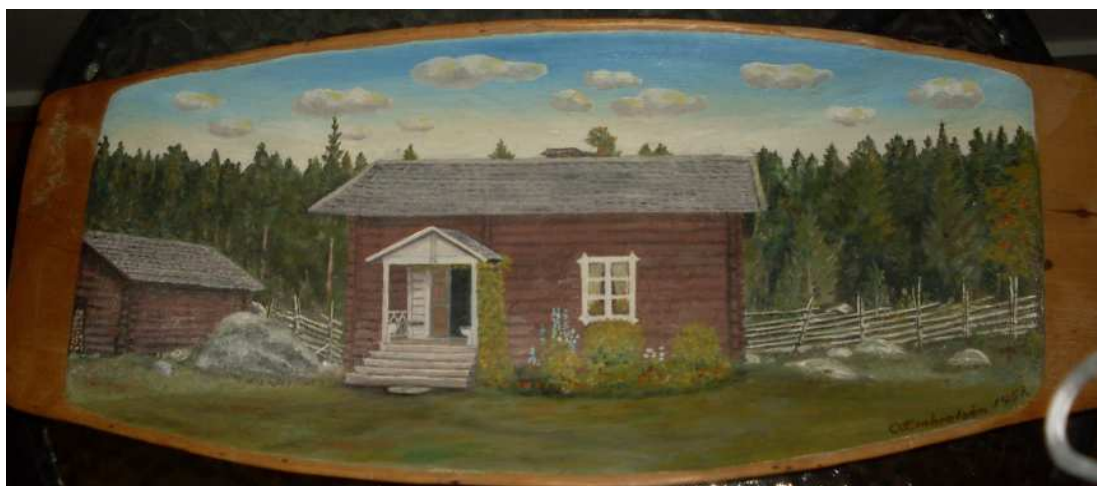
(Gården i Lillöjungsbo, som senare blev ett hemman för släkten)