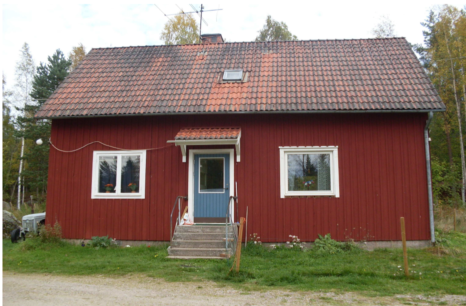
Ett x antal år senare byggdes ett nytt hus där bryggstugan stod en gång i tiden. Det nya huset står kvar än idag.