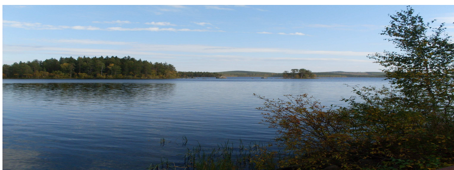
(Vy över Öjungen från Öjungskojan)