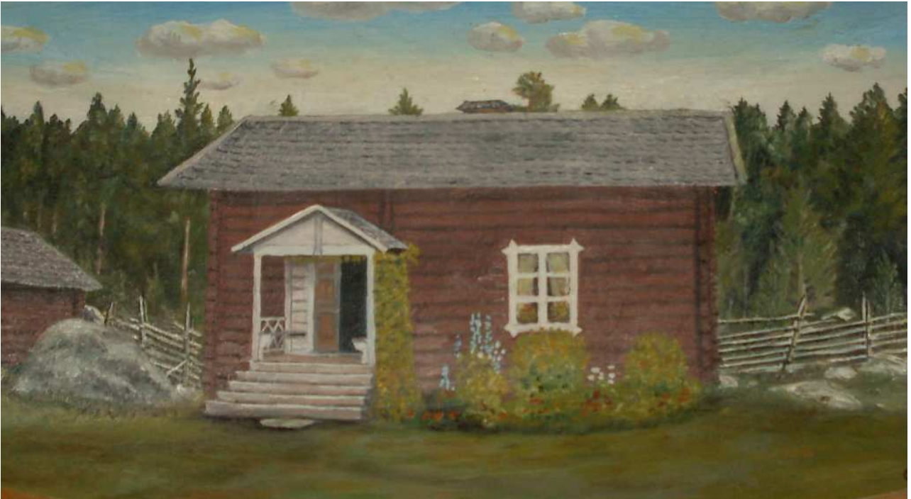
(O. Embretséns målning 1951 av gården i Lillöjungsbo är gjort på ett smörtråg)